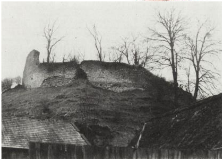
Widok zamku na Podgrodziu w 1975 r.